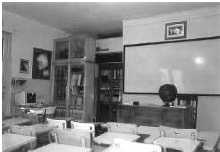
Biblioteca y aula de clases del observatorio

En los últimos años la Asociación Cooperadora ha emprendido un proceso de renovación tecnológica integral del observatorio. El telescopio mismo ha sido modernizado, pues se lo conectó a una nueva y potente computadora. Con ese fin