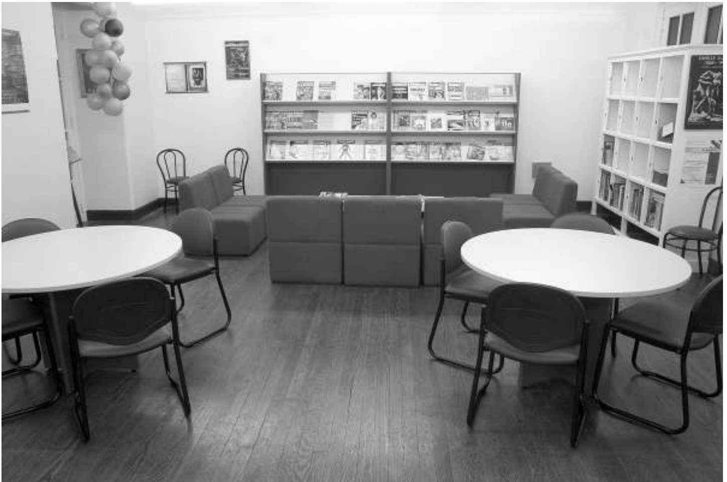
El «espacio intercambio» con mesas y sillas para un trabajo grupal..

do, a las 8 de la mañana. Sí, algunos chicos iban.