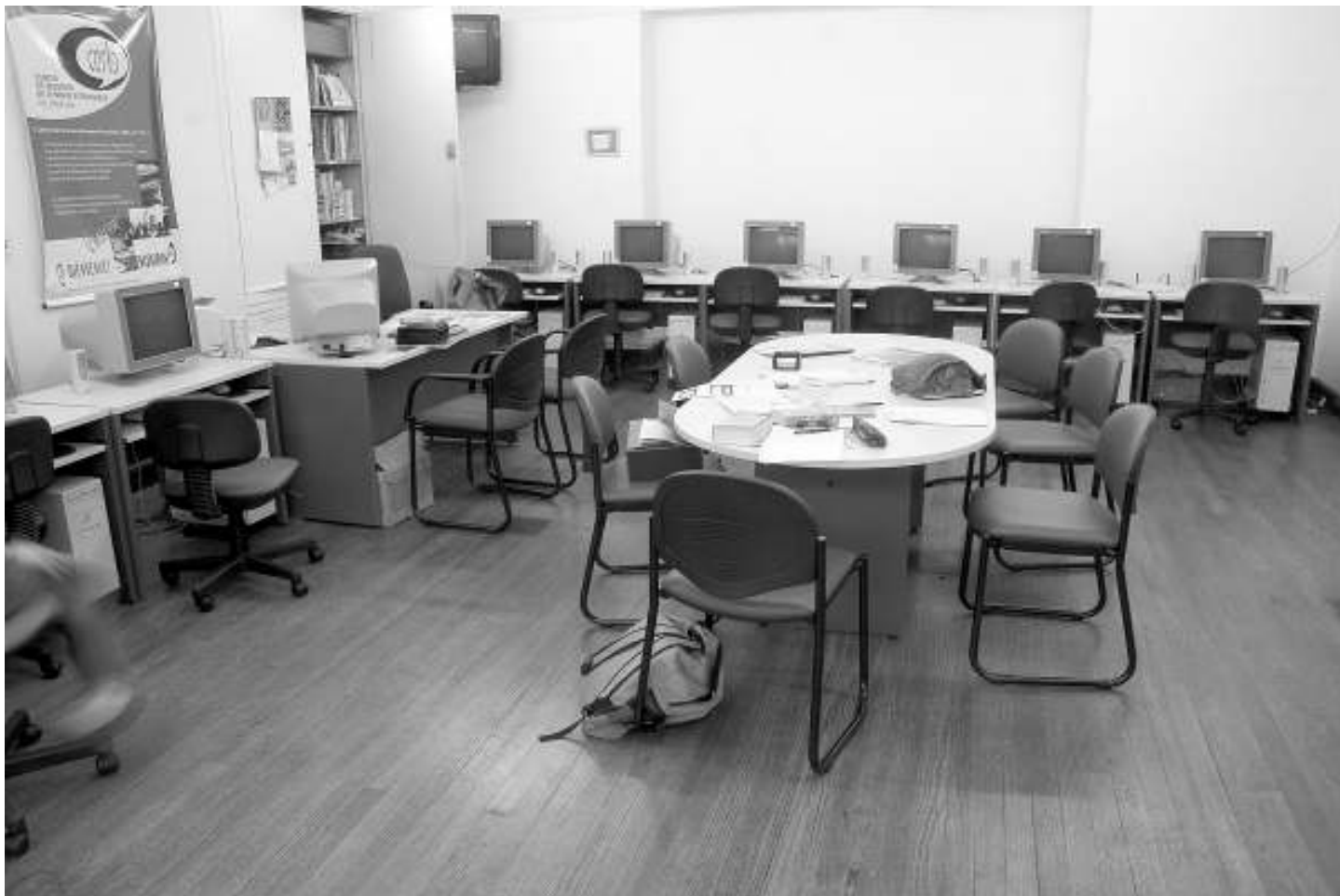
Un red de PCs con tecnología inalámbrica y equipadas con los más sofisticados periféricos multimediales.

Cuando ingresé como alumno en el CNBA existía en el subsuelo lo que se llamaba el laboratorio. Los alumnos que tenían dificultad en pronunciación (entonces se valoraba mucho) eran mandados al laboratorio. Era una actividad a contraturno. Allí nos sentaban frente a un grabador a casete, última tecnología para la época... Había que escuchar, grabarse y escucharse. No se cuánto tiempo duró eso ni cuál fue el resultado.